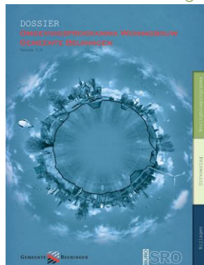
Omgevingsprogramma 1.0 + structuurmodel Winssen