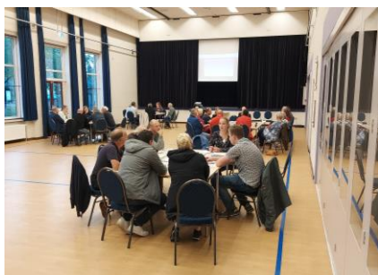
Gesprekstafels Winssen 27 en 29 september 2021