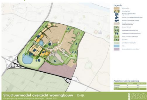
Concept structuurmodel Ewijk