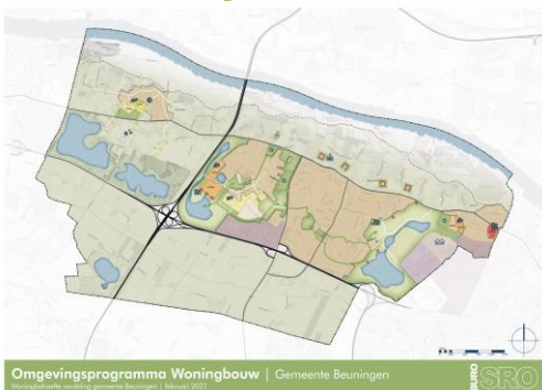
Concept Panorama 2040, 'Authentiek Beunings' met een vleugje stad'