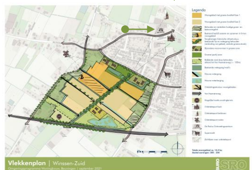
Concept structuurmodel Winssen