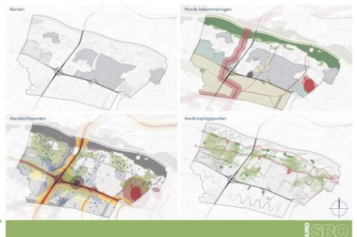
Analyse zoekgebieden woningbouw