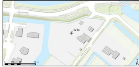
Rapportage september 2018